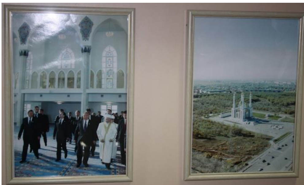
Рисунок 2. Посещение мечети Н. Назарбаевым и Д. Медведевым во время V Международного форума глав приграничных территорий Казахстана и России

помещения, которое используется в качестве музея. Часть экспозиции музея связана с деятельностью Газиза Амирханова, одного из инициаторов строительства мечети, ставшего имамом мечети и ответственным