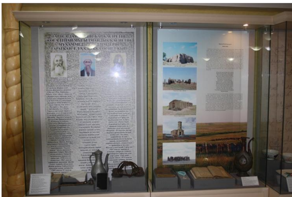
Рисунок 3. Стенды, посвященные религиозным деятелям и разрушенным в советское время мечетям

за музей. В этой истории пересекаются разные нарративные линии культурной перезагрузки постсоветского периода. На момент развала Советского Союза Амирханов работал в системе образования,