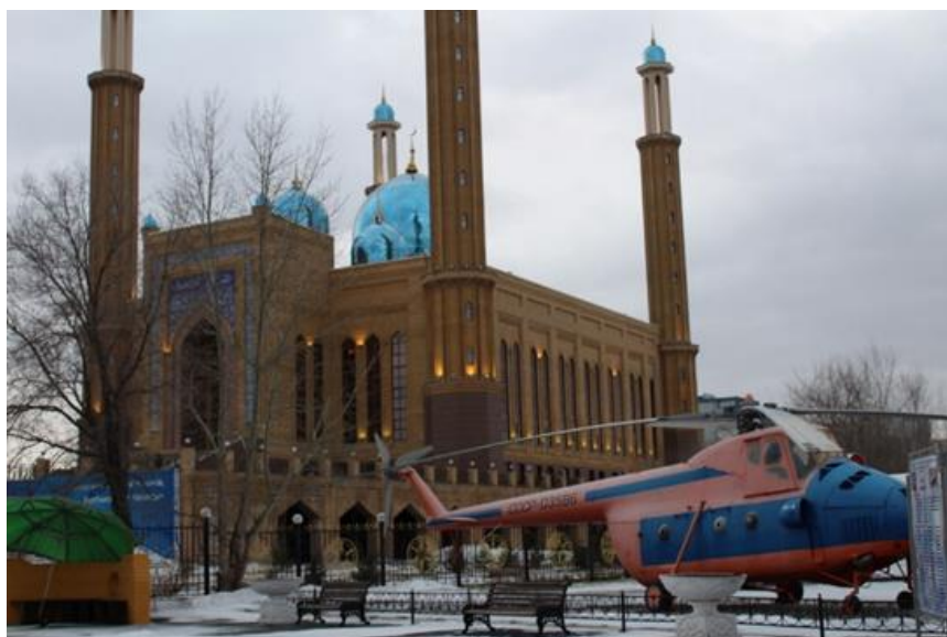
Рисунок 5. Мечеть «Халифа Алтай» г.Усть-Каменогорск (фото К. Медеуовой)

экспериментов по созданию масштабных экспозиций по примеру государственных историко-краеведческих музеев. Наиболее ярким примером этого является музей исламской культуры, который был открыт в 2019 году при центральной мечети «Халифа Алтай» в г. Усть-Каменогорск (Рисунок 5).