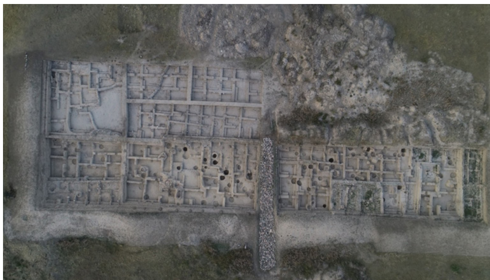
Сурет 2. Ортағасырлық Қастек қаласы. Қаланың қазба жұмыстары жүргізілген бөлігі. Аэрофотосуреті. 2020 жыл (А. Нұржанов бойынша)

Жер жаннаты деп есептелетін өлкені тереңірек зерттеген Р. Аболиннің ғылыми