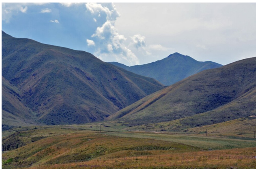
Сурет 1. Қаланың орналасқан аумағы, 2019 жыл (А. Нұржанов бойынша)

Ортағасырлық қаланың аумағы – 30 га құрайды. Оның 5 га жері цитадель мен шахристанға тиесілі, ал 25 га жер жеке