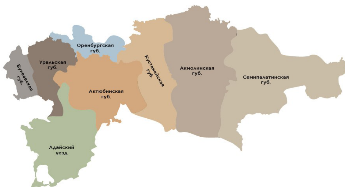
Административно-территориальная карта Казахстана 1920-1924 гг.