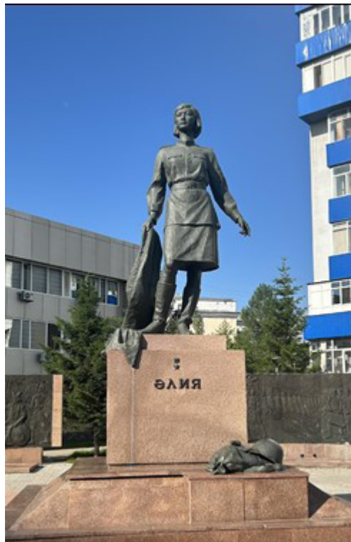
Фото 2. Әлия Молдағұлова ескерткіші.

Еліміз тәуелсіздік алғаннан кейін, Әлия Молдағұловаға арналған алғашқы ескерткіштерінің бірі 1995 жылы Ақтөбе облысы Қобда ауданы, Әлия ауылының Ю.Гагарин көшесінде орнатылған (фото 1). Ескерткіште автор Әлия Молдағұлованың толық бойымен шинель жамылған мүсінін мәрмәрдан жасаған (aktobenasledie.kz).