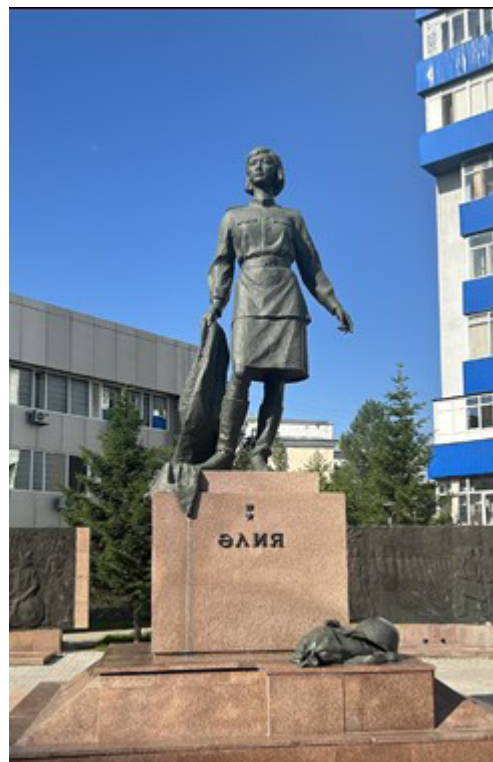
Фото 2. Әлия Молдағұлова ескерткіші. (фото Д. Оразбаева, 2024 ж.)

Еліміз тәуелсіздік алғаннан кейін, Әлия Молдағұловаға арналған алғашқы ескерткіштерінің бірі 1995 жылы Ақтөбе облысы Қобда ауданы, Әлия ауылының Ю.Гагарин көшесінде орнатылған (фото 1). Ескерткіште автор Әлия Молдағұлованың толық бойымен шинель жамылған мүсінін мәрмәрдан жасаған (aktobenasledie.kz).