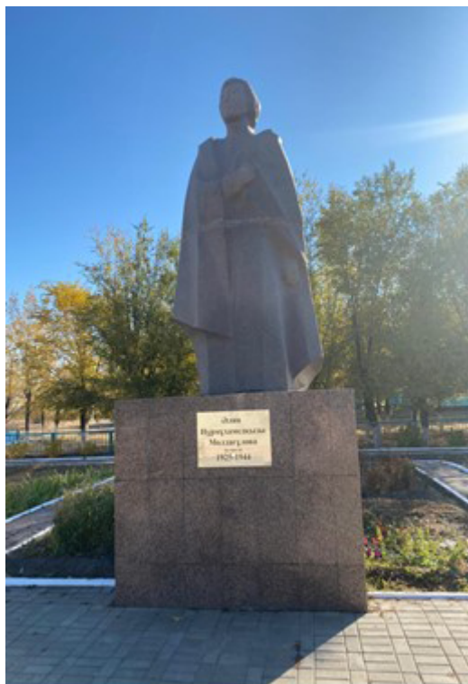
Фото 1. Әлия Молдағұлова ескерткіші. (фото Д. Оразбаева, 2024 ж.)

Кеңес Одағының батыры ретінде Әлия Молдағұлованың ескерткіштері Қазақстанның әр өңірінде орнатылған. Алайда, ең алдымен, Әлия Молдағұлованың туған жері Ақтөбе облысы, Қобда елді мекенінде орнатылған ескерткішті далалық зерттеу тәсілімен мақала нысанына айналдыруды жөн санадық.