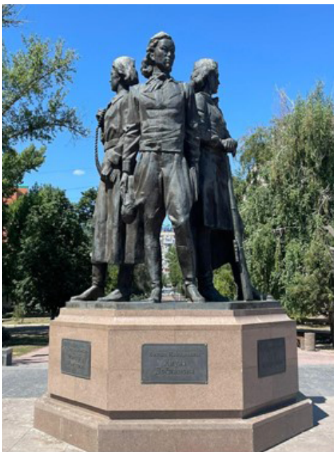
Фото 5. Орал қаласындағы ескерткіш компазиция

Сонымен қатар, Әлия Молдағұлованың ескерткіштері тек біздің елде емес, Ресей Федерациясының Санкт-Петербург қаласында 2019 жылы орнатылған (фото 4). Ескерткіш Санкт-Петербург қаласының батысындағы сквердің бірінде Красногвардия ауданындағы өз атына берілген көшеде орналасқан. Онда батырдың есімі мен жапсырма жұлдызы бедерленген. Постаменттің сыртқы жағында Әлия Молдағұлованың ерлігі жайында қашап жазылған.