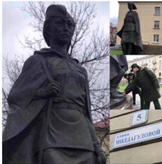
Фото 4. Әлия Молдағұлова ескерткіші Санкт-Петербург қаласы, (фото М. Төлепберген, 2022 ж.)

Сонымен қатар, Әлия Молдағұлованың ескерткіштері тек біздің елде емес, Ресей Федерациясының Санкт-Петербург қаласында 2019 жылы орнатылған (фото 4). Ескерткіш Санкт-Петербург қаласының батысындағы сквердің бірінде Красногвардия ауданындағы өз атына берілген көшеде орналасқан. Онда батырдың есімі мен жапсырма жұлдызы бедерленген. Постаменттің сыртқы жағында Әлия Молдағұлованың ерлігі жайында қашап жазылған.