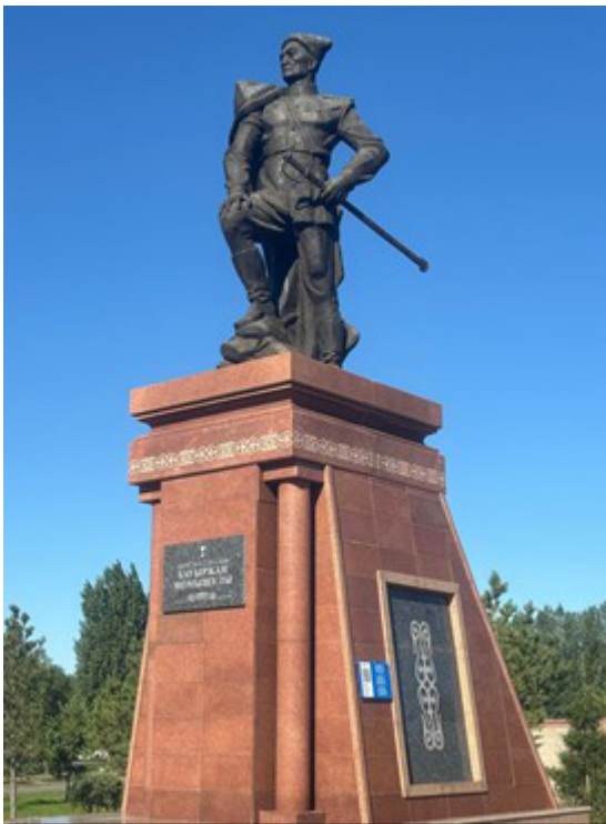
Фото 7. Бауыржан Момышұлы ескерткіші (фото Д. Оразбаева, 2024 ж.)

Батырдың түйіндеуінен түсінгеніміз, бейбіт заманда күн көріп жатқан адамдар қоғамында әп-сәтте орын алған соғыс өрті адамның аяқ асты өзгеруі, оның болмысының біз біле бермейтін қадамдарға баруы. Қолына қару алып, адам баласына қарсы оқ ату қаншалықты әсерге қалдырмақ. Осы орайда адам алдында таңдау жасау мен шешім қабылдау пайда болады. Таңдау жасаудың соңы объективті деңгейдегі Отан қорғауға ұласады. Майдан алаңында адам болмысы өзін қауіпті қатерге тігеді. Бұл, адам болмысының макродеңгейге көтерілуін аңғартады. Тарихи сана бекіткен тұжырым мұндайда: «Ер елі үшін туады, елі үшін өледі» деп қысқа қайырады.