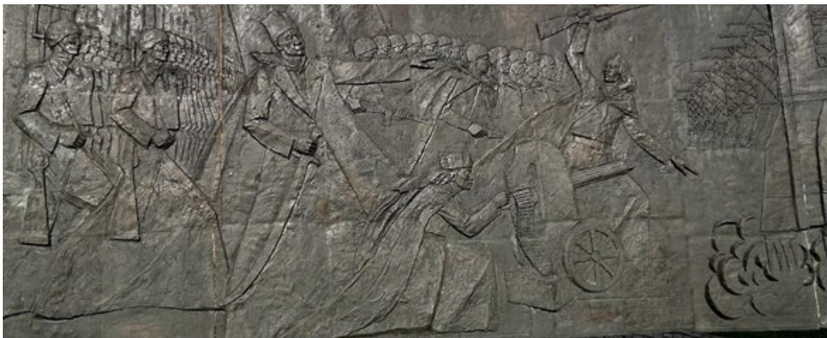
Фото 3. Әлия Молдағұлова ескерткішінің барельефі (фото Д. Оразбаева, 2024 ж.)

Мүсінге көз жүгіртсек, Ә.Молдағұлова майдан даласындағы әсерді бейнелеп тұрғандай. Ескерткіштің екі жағынан барельеф орнатылған. Барельефтің сол жақ жартысында ұлы дала бейнесі, көшпенділер рухы бейнеленген. Құрманғали мен Абылайхан бейнесі де назардан тыс қалмаған. Оң жағында 1916 жылғы отаршылдыққа қарсы көтерілістен бастап көптеген қайғы – қасірет әкелген Екінші дүниежүзілік соғысын, халқымызды жан-жаққа шашыратқан көріністер бейнеленген. Барельеф авторы мүсінші – Е.А. Сергебаев (Нұр-Сұлтанның мәдени және тарихи ескерткіштері, 2008).