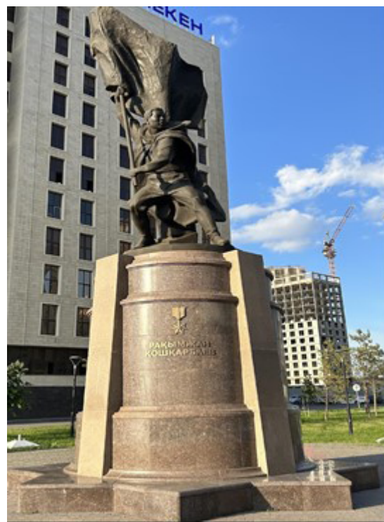
Фото 8. Рақымжан Қошқарбаев ескерткіші (фото Д. Оразбаева, 2024 ж.)

Батырлықтың, ерліктің символына айналған Бауыржан Момышұлының алғашқы ескерткіштерінің бірі Тараз қаласында орнатылған. Ескерткіштің орналасқан жері