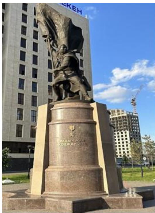
Фото 8. Рақымжан Қошқарбаев ескерткіші (фото Д. Оразбаева, 2024 ж.)

Батырлықтың, ерліктің символына айналған Бауыржан Момышұлының алғашқы ескерткіштерінің бірі Тараз қаласында орнатылған. Ескерткіштің орналасқан жері