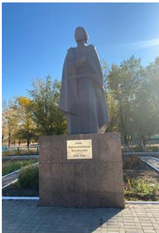
Фото 1. Әлия Молдағұлова ескерткіші.

Кеңес Одағының батыры ретінде Әлия Молдағұлованың ескерткіштері Қазақстанның әр өңірінде орнатылған. Алайда, ең алдымен, Әлия Молдағұлованың туған жері Ақтөбе облысы, Қобда елді мекенінде орнатылған ескерткішті далалық зерттеу тәсілімен мақала нысанына айналдыруды жөн санадық.