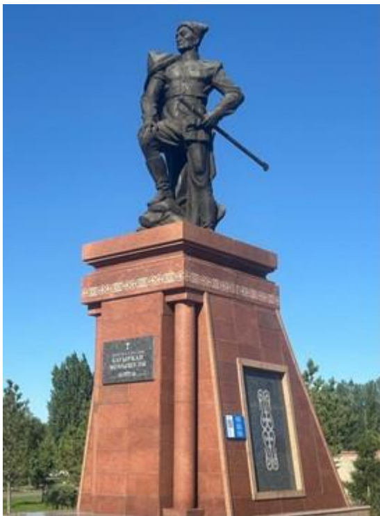
Фото 7. Бауыржан Момышұлы ескерткіші

Батырдың түйіндеуінен түсінгеніміз, бейбіт заманда күн көріп жатқан адамдар қоғамында әп-сәтте орын алған соғыс өрті адамның аяқ асты өзгеруі, оның болмысының біз біле бермейтін қадамдарға баруы. Қолына қару алып, адам баласына қарсы оқ ату қаншалықты әсерге қалдырмақ. Осы орайда адам алдында таңдау жасау мен шешім қабылдау пайда болады. Таңдау жасаудың соңы объективті деңгейдегі Отан қорғауға ұласады. Майдан алаңында адам болмысы өзін қауіпті қатерге тігеді. Бұл, адам болмысының макродеңгейге көтерілуін аңғартады. Тарихи сана бекіткен тұжырым мұндайда: «Ер елі үшін туады, елі үшін өледі» деп қысқа қайырады.