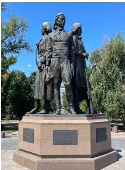
Фото 5. Орал қаласындағы ескерткіш компазиция

Сонымен қатар, Әлия Молдағұлованың ескерткіштері тек біздің елде емес, Ресей Федерациясының Санкт-Петербург қаласында 2019 жылы орнатылған (фото 4). Ескерткіш Санкт-Петербург қаласының батысындағы сквердің бірінде Красногвардия ауданындағы өз атына берілген көшеде орналасқан. Онда батырдың есімі мен жапсырма жұлдызы бедерленген. Постаменттің сыртқы жағында Әлия Молдағұлованың ерлігі жайында қашап жазылған.