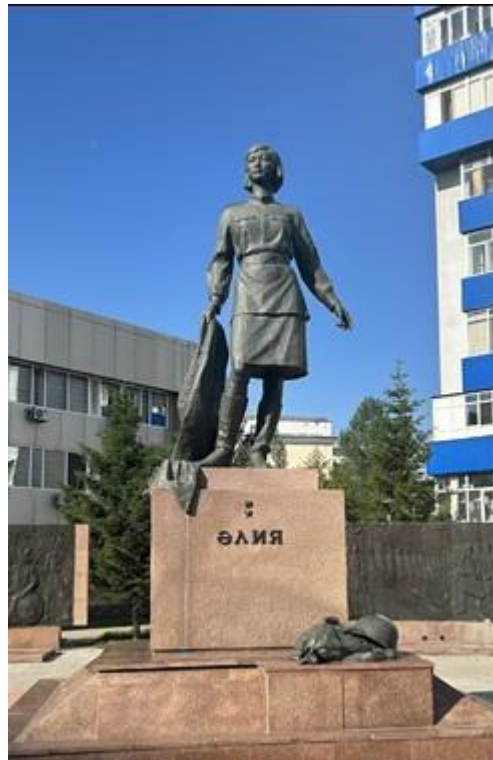
Фото 2. Әлия Молдағұлова ескерткіші. (фото Д. Оразбаева, 2024 ж.)

Еліміз тәуелсіздік алғаннан кейін, Әлия Молдағұловаға арналған алғашқы ескерткіштерінің бірі 1995 жылы Ақтөбе облысы Қобда ауданы, Әлия ауылының Ю.Гагарин көшесінде орнатылған (фото 1). Ескерткіште автор Әлия Молдағұлованың толық бойымен шинель жамылған мүсінін мәрмәрдан жасаған (aktobenasledie.kz).