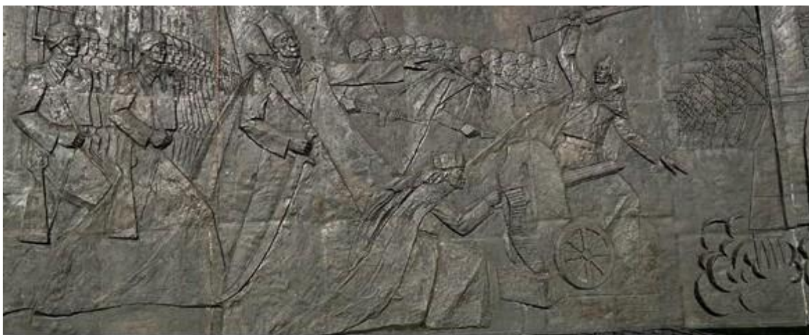
Фото 3. Әлия Молдағұлова ескерткішінің барельефі

Мүсінге көз жүгіртсек, Ә.Молдағұлова майдан даласындағы әсерді бейнелеп тұрғандай. Ескерткіштің екі жағынан барельеф орнатылған. Барельефтің сол жақ жартысында ұлы дала бейнесі, көшпенділер рухы бейнеленген. Құрманғали мен Абылайхан бейнесі де назардан тыс қалмаған. Оң жағында 1916 жылғы отаршылдыққа қарсы көтерілістен бастап көптеген қайғы – қасірет әкелген Екінші дүниежүзілік соғысын, халқымызды жан-жаққа шашыратқан көріністер бейнеленген. Барельеф авторы мүсінші – Е.А. Сергебаев (Нұр-Сұлтанның мәдени және тарихи ескерткіштері, 2008).